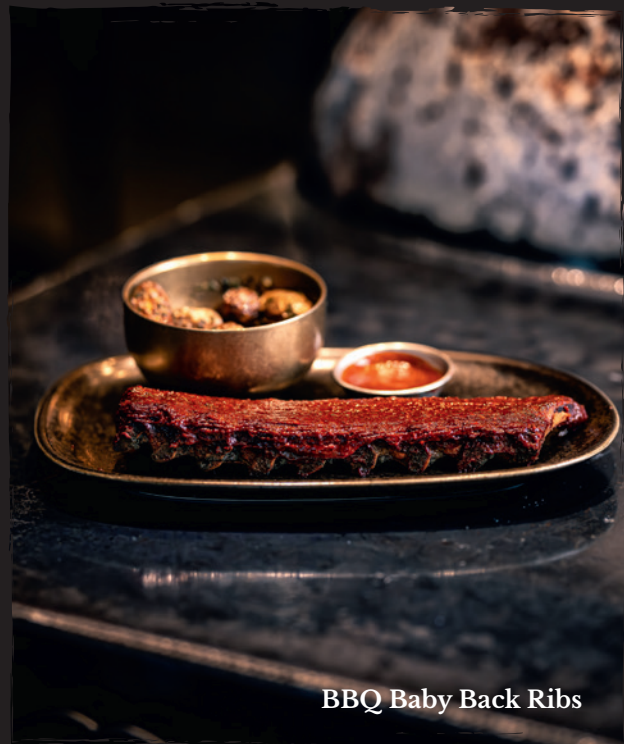
BBQ Baby Back Ribs