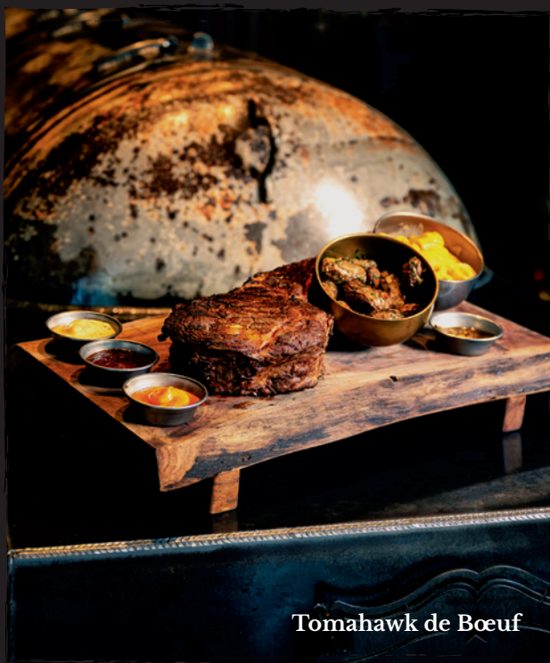
Tomahawk de Bœuf

Chez Daltons, le braisage, c'est la patience et le feu au service du goût... une technique authentique et terriblement efficace.