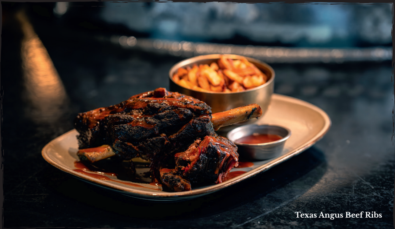
Texas Angus Beef Ribs