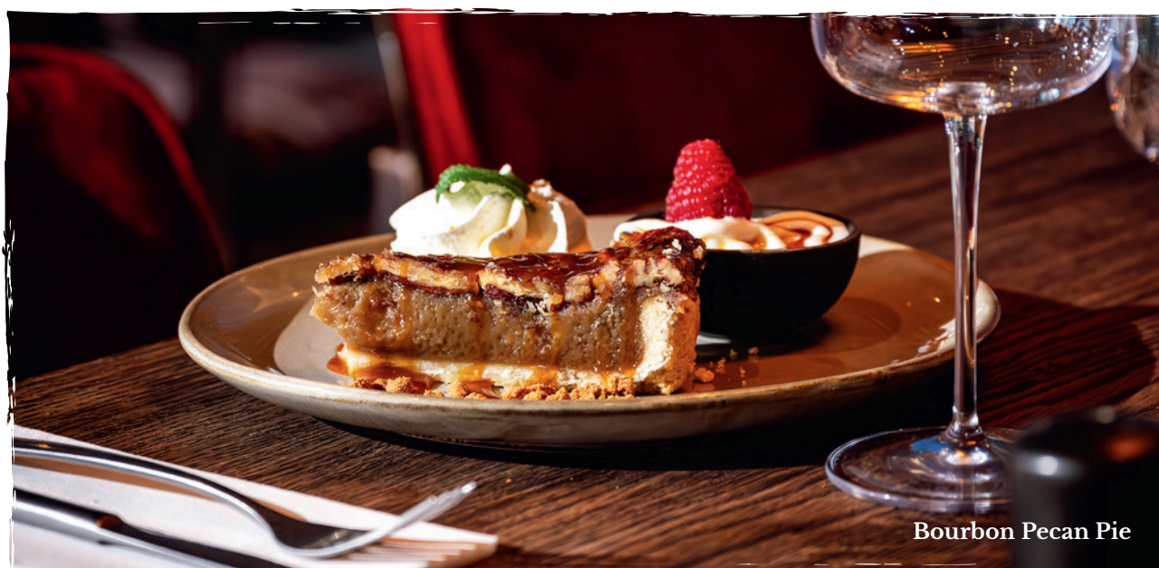
Bourbon Pecan Pie