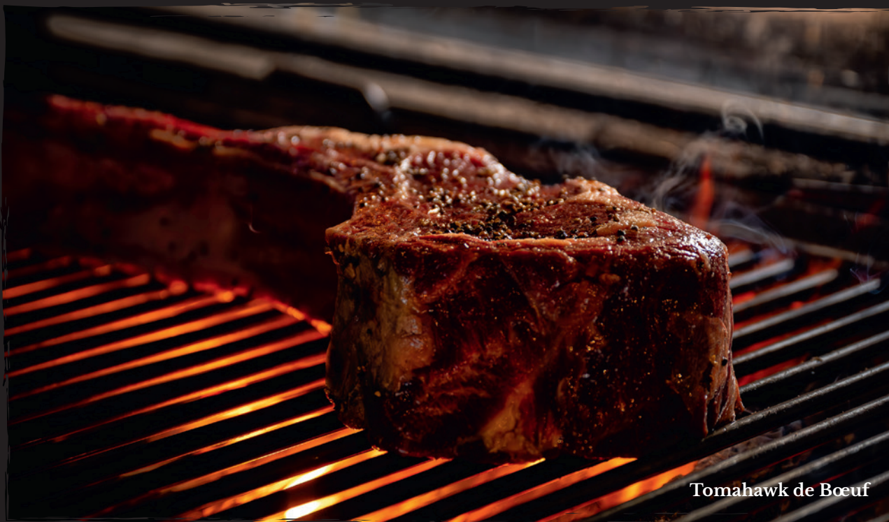
Tomahawk de Bœuf